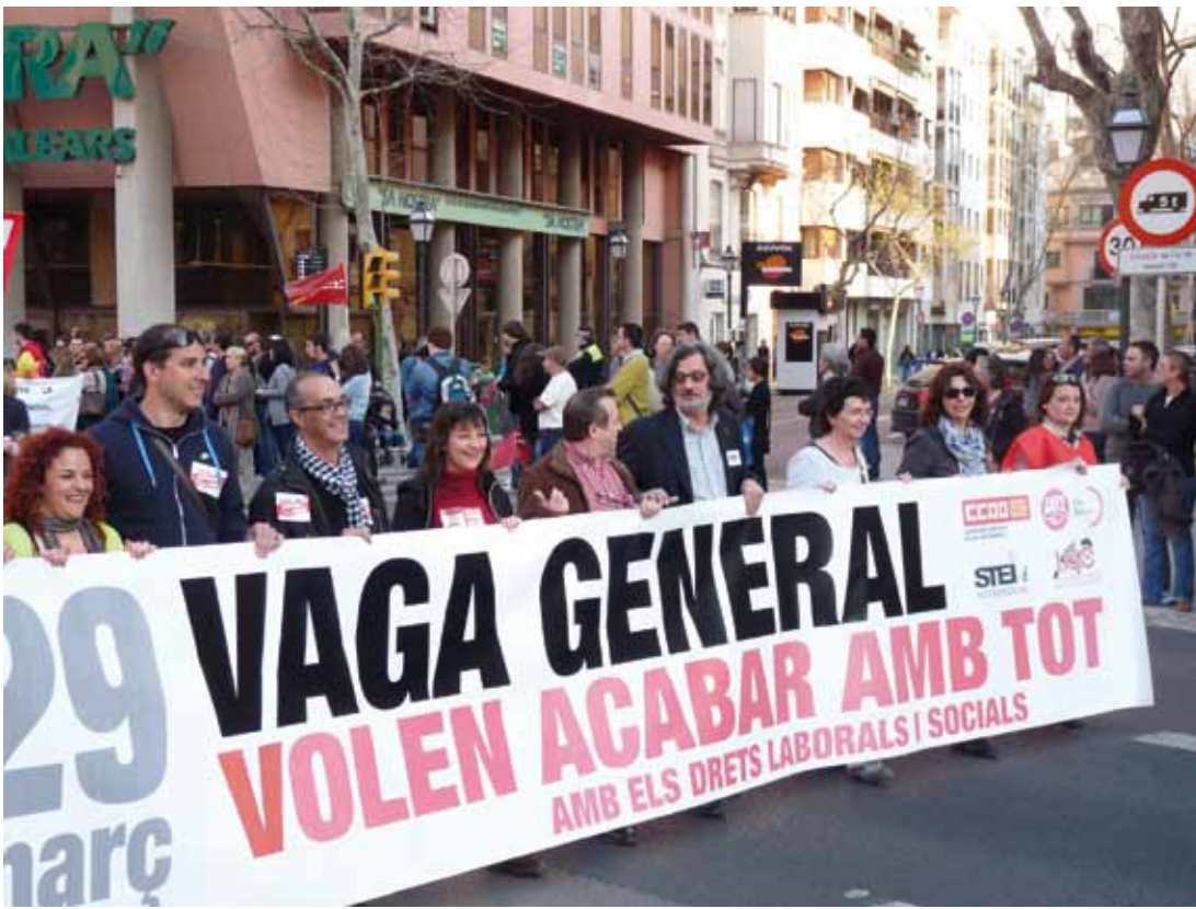
Pancarta dels quatre sindicats encapçalant la manifestació a Palma.