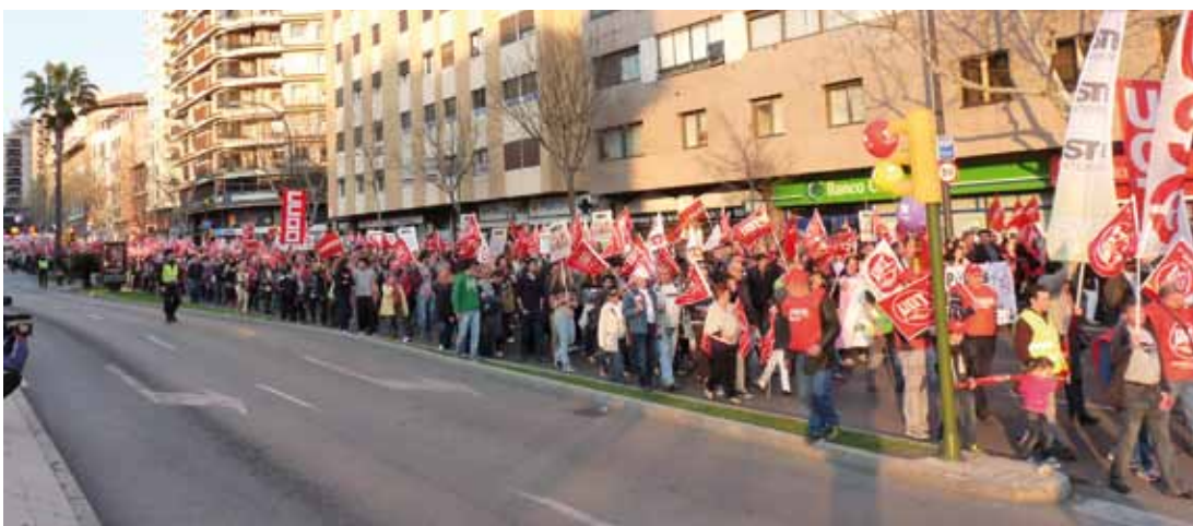
Manifestació i cadena humana pels carrers de Palma.