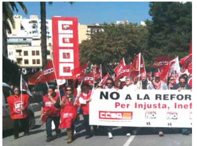
Manifestació pels carrers d'Eivissa.