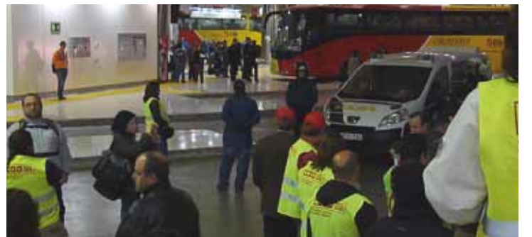
Piquets a la Intermodal de Palma.