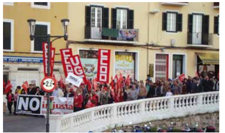
Manifestació pels carrers de Maó.