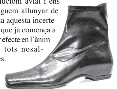
Calçat de l'empresa sabatera Farrutx