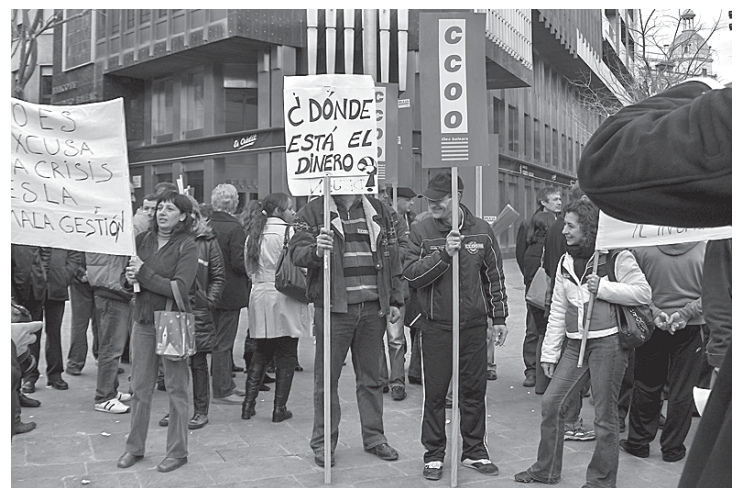
Els companys de l'hotel Son Vida, reivindicatius pels carrers de Palma.

farien si realment fossin acomiadaments justificats. Ara diuen que, amb la crisi, necessiten més flexibilitat laboral, però quan no n'hi havia, de crisi, ben bé que han abusat de les contractacions temporals, precàries i fraudulent... En realitat, tenen molta barra i, amb l'excusa de la crisi, volen abaratir els costos de l'acomiadament i de la feina i fer-nos més dèbils al si dels centres de treball. Una altra gran mentida és la suposada necessitat dels Expedients de Regulació d'Ocupació (ERO); ara resulta que la decisió empresarial unilateral de deslocalització per enriquir-se més i més, l'han convertida en una causa d'acomiadament col·lectiu protegit per l'Estatut dels Treballadors. És una autèntica perversió convertir una legislació relativament protectora del dret al treball en una fórmula per practicar allò que entenem per «agafa els doblers i posa't a corre». És una insolència empresarial fer el que volen en matèria salarial: s'han inventat una fórmula màgica per reclamar-nos «pactes salarials excepcionals» perquè no s'apugin els salaris i sí en canvi els beneficis. Què vol aquesta gent que, per exemple, no fan ni brot per tal que Spanair es quedi a Mallorca o per desestacionalitzar el sector turís-