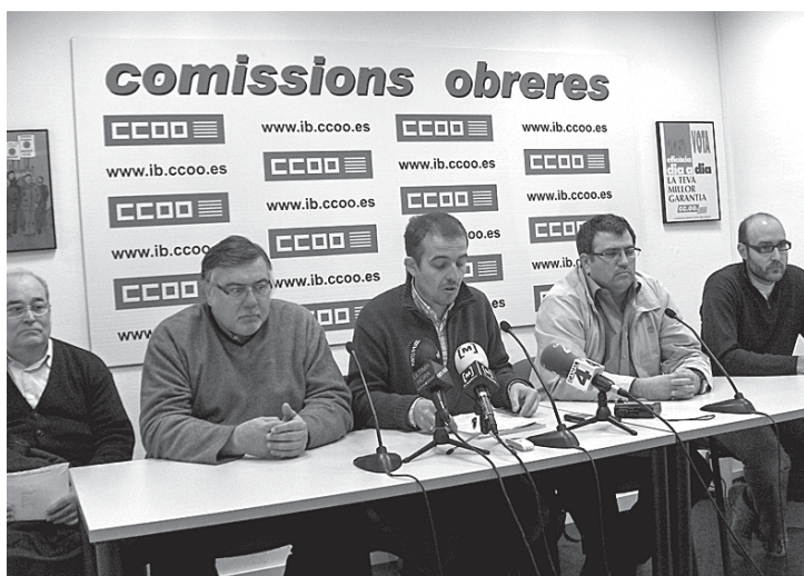
La companyia Futura presentà un ERO que afecta tota la plantilla.

anys d'una política governamental i empresarial absolutament insostenible (tsunami constructiu i turisme estacional i de baix valor afegit) que ha fet que el que podem anomenar com a via balear d'inserció al procés de globalització ens ha situat en una posició molt feble per fer front a aquestes malifetes del capitalisme universal. Aquesta crisi de la globalització, tal com diu la Confederació Sindical Internacional, només la podem afrontar amb un nou internacionalisme, per conquerir un món més solidari i sostenible. Idò, ja està bé! Hem de sortir al carrer com ho fan els treballadors, les treballadores i els seus sindicats gairebé arreu del planeta!