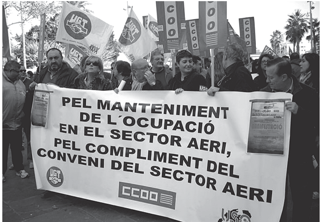
Mobilització per la crisi en el sector aeri.

Ens volen fer passar per beneïts i fer-nos creure que tots els acomiadaments que els empresaris fan són justificats per la crisi. És fals, i per això paguen la impropedència dels acomiadaments, el que no