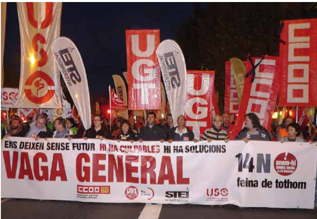
Pancarta unitària encapçalant la manifestació a Palma.

xa convocada a Palma, la secretària general de CCOO, Katiana Vicens, afirmà que més de seixanta organitzacions sindicals "se solidaritzaren amb els pobles del sud d'Europa". I afegí: "No estam tots sols, el món ens està mirant".