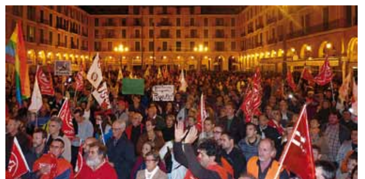
Final de la protesta a la plaça Major.