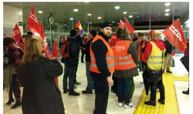
Piquets a la Intermodal de Palma.