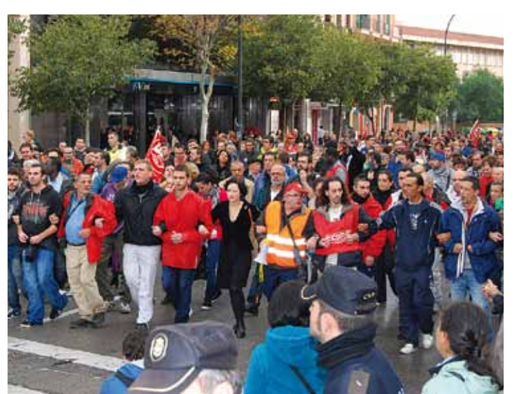
Piquets informatius per les avingudes de Palma.