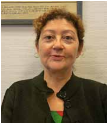
EVA B. CERDEIRIÑA SECR. POLÍTICA SOCIAL, IMMIGRACIÓ I COOPERACIÓ