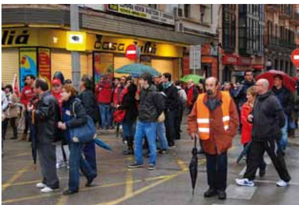
Piquets informatius pel centre comercial de Palma.