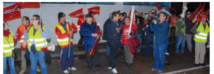
Piquets a Emaya.