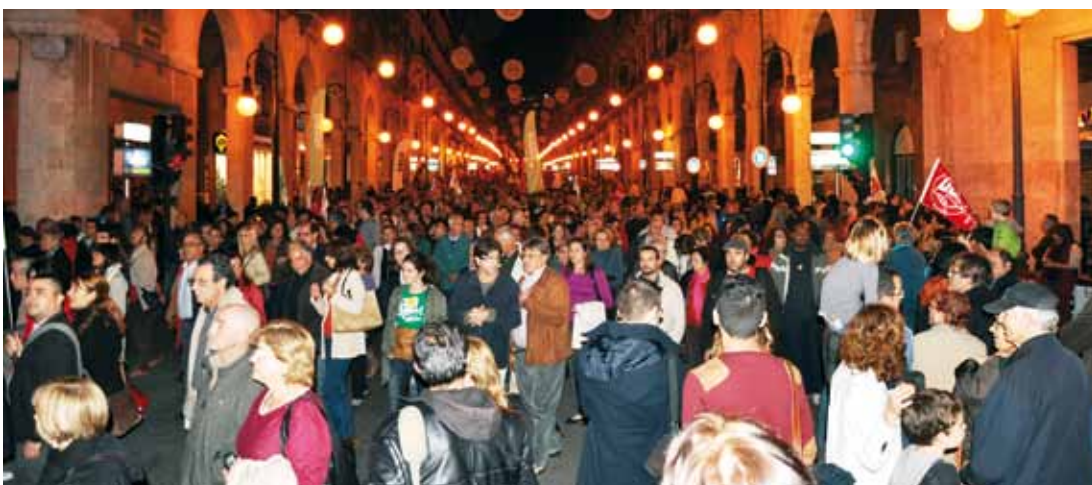
Manifestació pel carrer Jaume III.